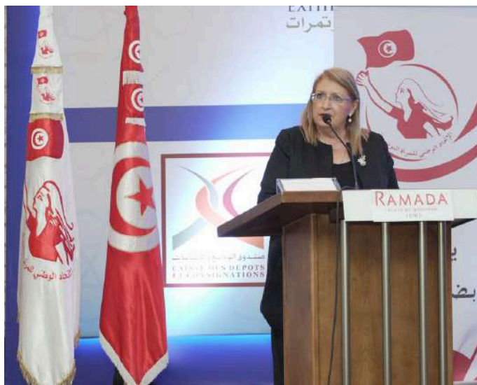
Madame Marie Louise Coleiro Preca ancienne présidente de la République de Malte