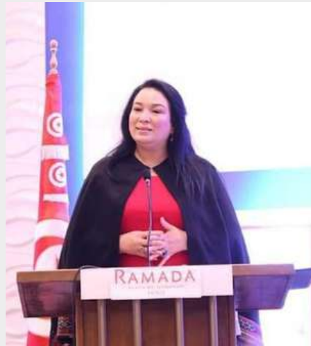
Madame Amel Belhaj Moussa Ministre de la Femme, de la Famille, de l'Enfance et des Seniors

Madame Amel Belhaj Moussa Ministre de la Femme, de la Famille, de l'Enfance et des Seniors, a pris la parole pour inaugurer la séance en annonçant la tenue prochaine d'un atelier visant à élaborer une stratégie pour accroître la participation des femmes à la création de petites et moyennes entreprises, dans le but de promouvoir l'égalité des chances en matière de création de richesse. Elle a également souligné que 83 % des Femmes à la tête d'entreprises sont diplômées de l'enseignement supérieur.